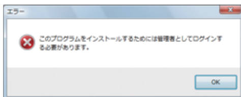
④『DVD Fab HD Decrypter』の場合のエラー画面