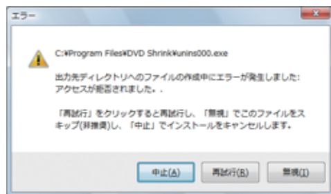
④『DVD Shrink』の場合のエラー画面