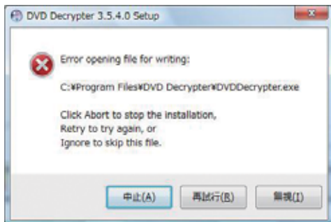
④『DVD Decrypter』の場合のエラー画面

収録ソフトウェアのインストール時に、アクセス拒否のエラーが表示された場合、自分がログインしているアカウントが管理者権限かを確認して欲しい。セキュリティ対策のため、一般ユーザーのアカウントでは、正常にインストールすることができないソフトウェアが多い。自分のアカウントを管理者権限に変更するには、ログインする際に管理者権限 (Administrator) でログインしなければならない。本誌では管理者権限のユーザーを「管理者」とし、権限のないユーザーを「一般ユーザー」として説明していく。