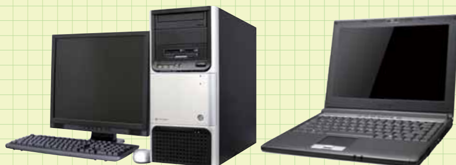
デスクトップパソコン